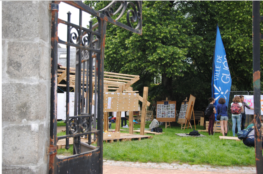
Atelier « diagnostic » ouvert à tous - juin 2016